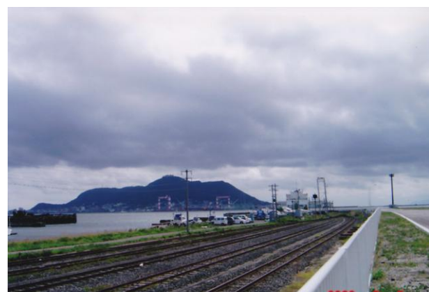
捕虜たちが働いた有川埠頭