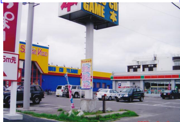
現在の収容所跡地